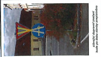
stavující dopravní značení bude po sobě stavby zrealizováno

STANOVENO OPATŘENÍM ČJ: 44/08998/2024 ZE DNE: 3-6-2024